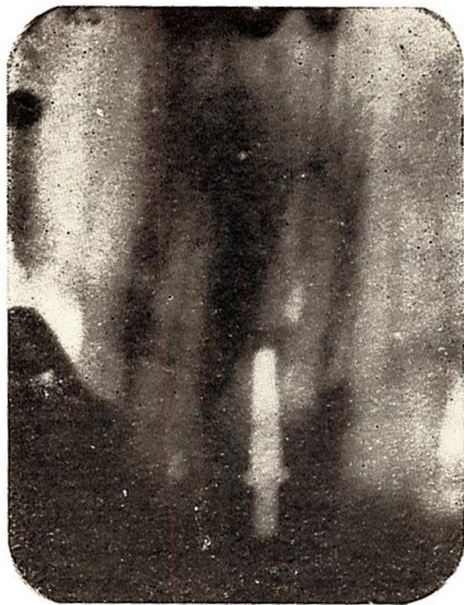
Fig. 1. — Quiste lateral