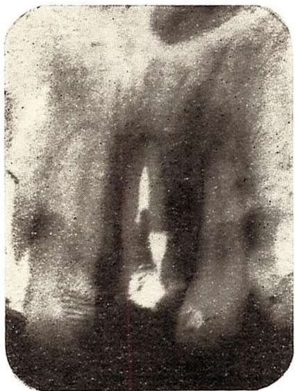
Fig. 2. — Obturada con amalgama la falsa ruta. (La radiografía está rotada. La parte derecha está a izquierda, por error de confección de clisé).