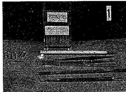
FIG. 1. — Se observa el material necesario, para la realización del examen: lápiz de grafito, grampas, de papel, espátulas de cemento y plástico, porta-objetos, fijador (alcohol a 96° o alcohol-éter en partes iguales).

B) Material requerido. — El material necesario se halla en todo consultorio dental y consta de: porta objetos; grampas para papel; lápiz de grafito; espátula (pueden ser usados los bajalenguas de madera o las espátulas metálicas para cemento o material plástico); líquido fijador (que puede ser alcohol etílico 96° o una mezcla de partes iguales de alcohol a 96° y éter sulfúrico); un formato historia clínica. (Fig. 1).